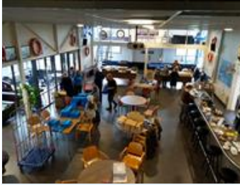
Vrijwilligers pakken de kerstpakketjes in en versieren de club, de kapel en hangen buitenverlichting.