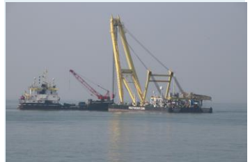
Berging schepen op de plaats waar de Cardium is gezonken