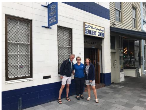
Het zeemanshuis in Hobart, Tasmanie