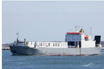
Bemanningsleden van de Cymbeline komen regelmatig naar THE FLYING ANGEL CLUB