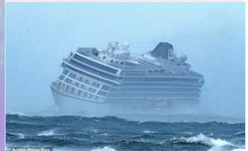
Viking Sky cruise ship stranded

Op dit moment wordt het eneroverende bedrijf geleid door de zoon van de oprichter, Wim van Splunder.