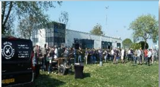
DAMEN barbecue for project Blue