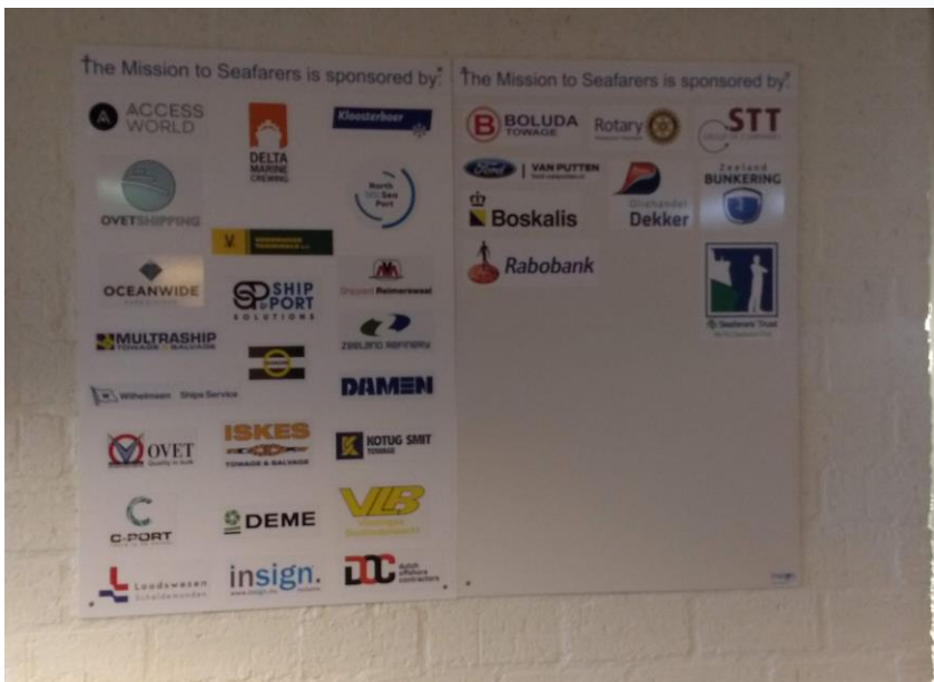
Sponsorsbord in the Flying Angel club