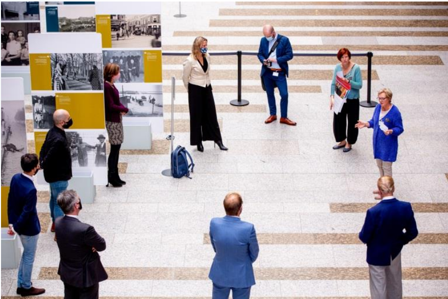
Aanbieden van de petitie op gepaste afstand

Nederland heeft een convenant ondertekend waar in staat dat er in elke haven, vanwege het welzijn van de zeevarenden, een zeemanshuis moet zijn. Helaas is de bijdrage die door de overheid werd gegeven bij een bezuinigingsronde in 2005 geschrapt door de Tweede Kamer