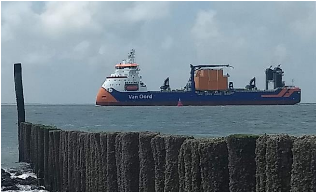
De Bravenes voor onze kust

Hartelijk dank aan de bemanning van het schip Bravenes. Zij hebben een envelop met een gift in de brievenbus van de voorzitter gedaan naar aanleiding van een artikel in de PZC over de benarde financiële situatie waarin het zeemanshuis zich bevindt. Acties zoals deze zijn van onschatbare waarde.