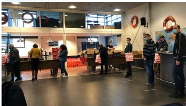
Parcel Packing in de Flying Angel Club, op gepaste afstand, natuurlijk.

Dit jaar is er een geweldige kerstpakkettenactie geweest. Aan alle kanten werden ons goederen aangeleverd en kregen we reacties van mensen die graag mee wilden doen. Ook zijn er heel wat spontane donaties binnen gekomen. Dit zorgde ervoor dat we veel meer kerstpakketten konden maken, ruim 600. Ook bij de schepen die in de haven bleven met kerst werden pakketten afgeleverd.