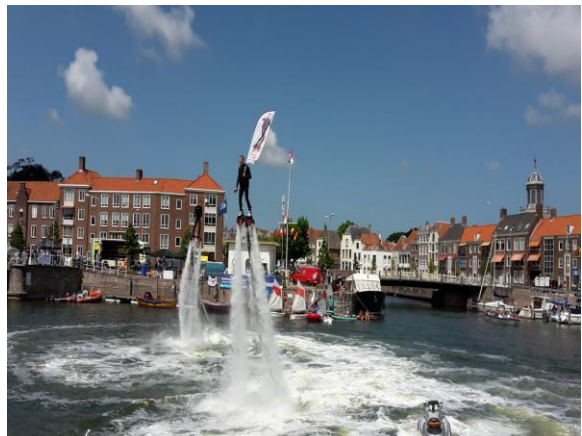
Spectaculair zicht op Watersportdag WV Arne 2018

Het Flying Angel Guild zal er zaterdag 10 juni ook bij zijn.