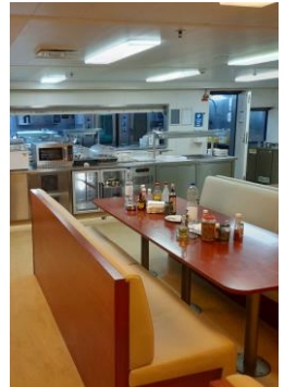
Het restaurant van de Sianna