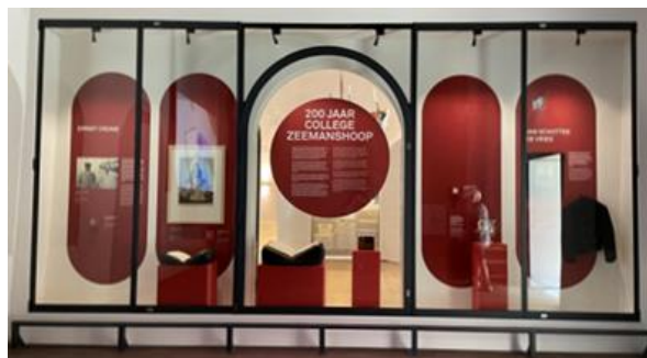
Een presentatie in het Scheepvaartmuseum

Zoals ik als eens eerder heb aangegeven ben ik ook voorzitter van de Nederlandse Zeevarenden Centrale, een overkoepelende landelijke organisatie waarbij alle zeemanshuizen zijn aangesloten. De NZC houdt zich momenteel bezig met structurele financiering via de overheid. Dat zijn lange trajecten, maar we hopen dat de gesprekken een positief resultaat op zullen leveren voor alle zeemanshuizen. Daarnaast zijn er veel Maritieme fondsen die de zeemanshuizen een warm hart toedragen.