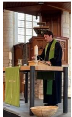
Zeezondag in de St Jacobskerk