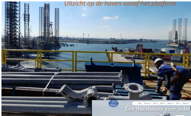
Uitzicht op de haven vanaf het platform