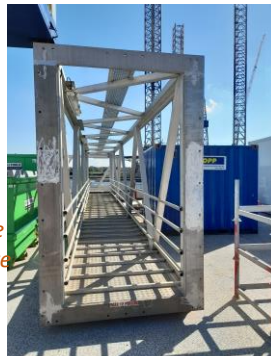
De platformbrug die de Sianna met het offshore platform verbindt